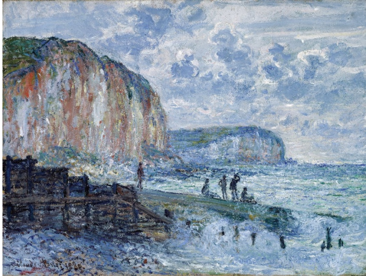
Les Petites Dalles peintes par Claude Monet en 1880

Entre ses falaises se niche une plage de galets à marée haute, qui libère une grande étendue de sable à marée basse. La plage dispose d'un poste de secours (baignade surveillée par des maîtres-nageurs en juillet et en août), et est équipée d'un treuil et d'un chenal à bateaux, d'un radeau et d'une zone de baignade.