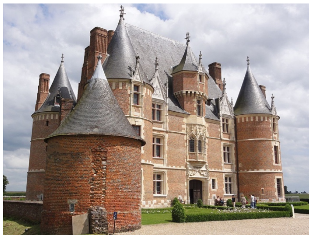
Le Château de Martainville

Adresse : Château de Martainville, 76116 Martainville-Épreville