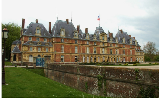
Le Château d'Eu, musée Louis-Philippe

Le Château de Martainville , qui abrite le musée des Traditions et Arts Normands, présente en plus de sa collection permanentes, de belles expositions à thèmes régionaux, ainsi que des activités en individuel ou en groupe.