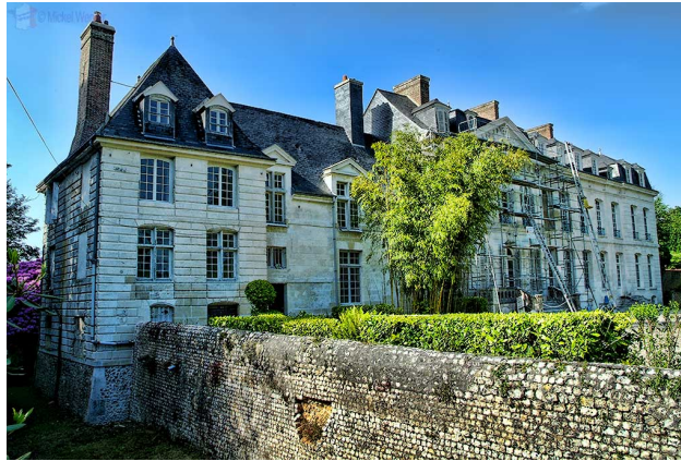
L'aile du Château de Filière au premier plan

Adresse : 471 rue du Château de Filières, 76430 Gommerville