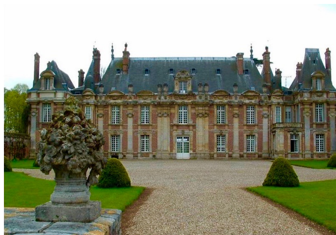
Le Château de Miromesnil

Adresse : Terres de Miromesnil, 76550 Tourville-sur-Arques