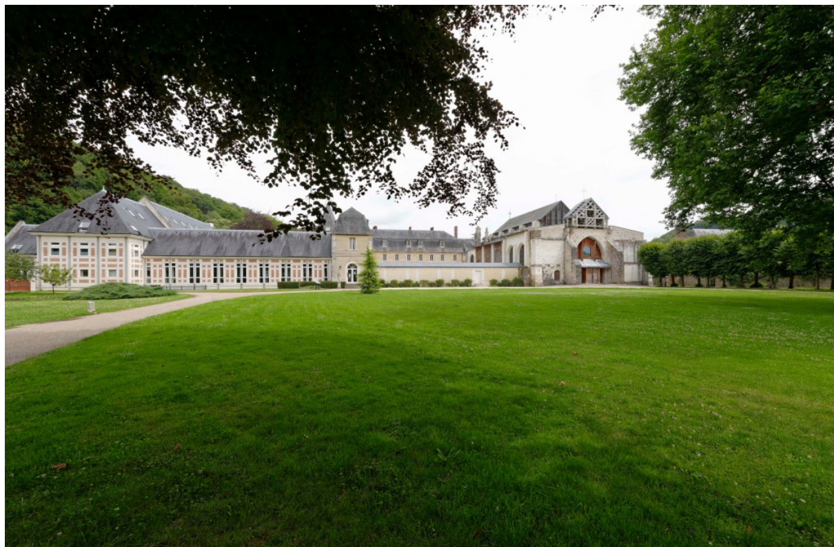
L'abbaye Notre Dame du Pré, à Valmont

33 Abbayes Normandes et 24 sites environnants à visiter sont répertoriés sur le site internet www.abbayes.normandes.com ! Pour tout renseignement sur les abbayes, les visites et ateliers : contact@abbayes-normandes.com