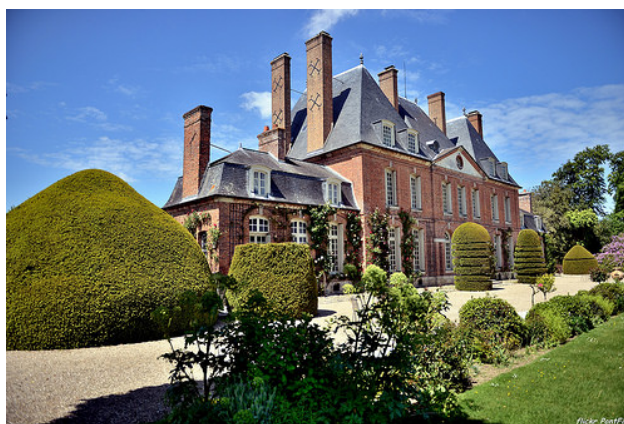
Le Château du Mesnil-Geoffroy

Adresse : 2, chemin de la Dame Blanche, 76740 Ermenouville