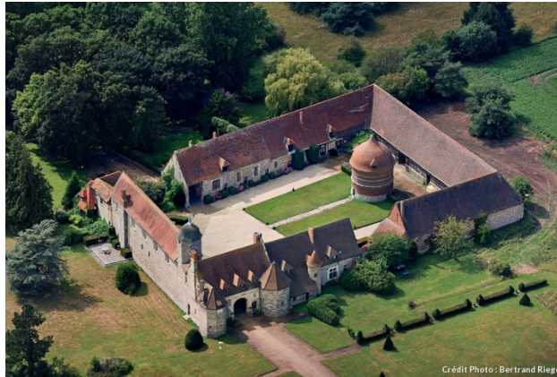
Vue aérienne du Manoir d'Ango

Si vous allez à Varengueville-sur-Mer, pensez aussi à visiter le Parc du Bois des Moutiers, l'Église Saint-Valéry et le Cimetière marin.