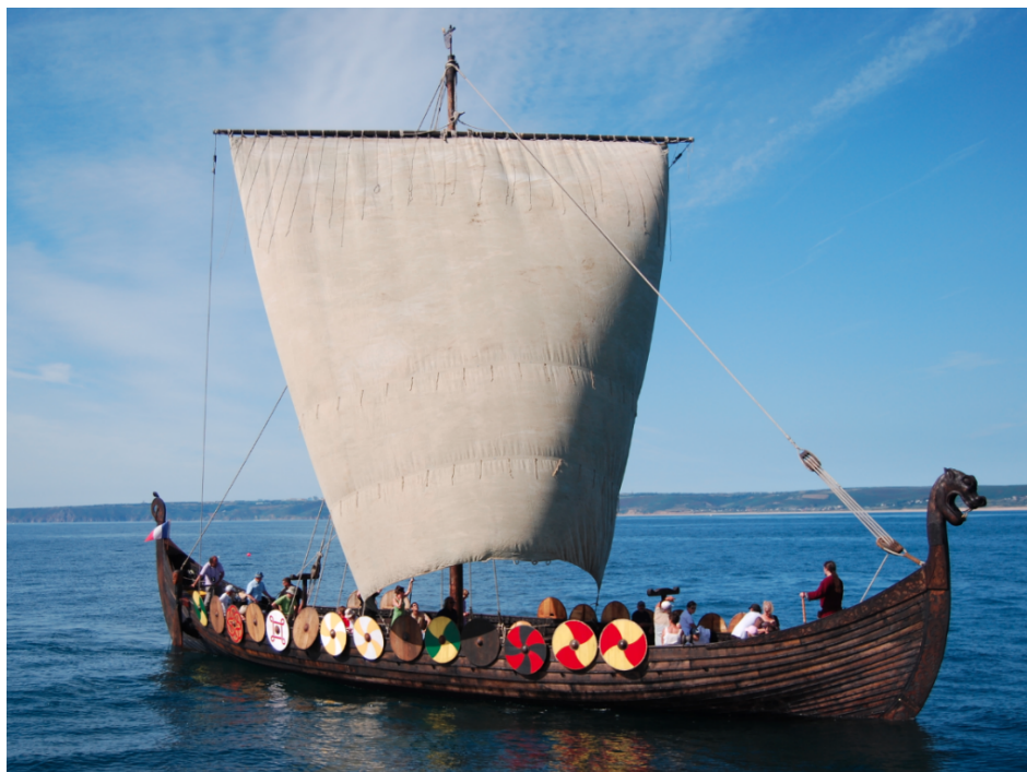
Pour la fête de la mer, le Dreknor, Drakkar reconstitué, accoste à Saint-Valery-en-Caux.