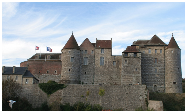
Le Château-Musée de Dieppe, perché sur la falaise