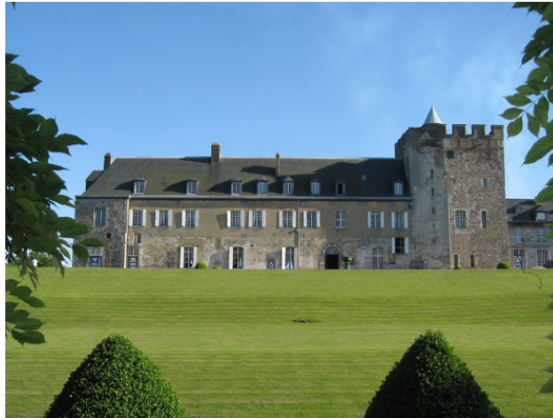
Le Château d'Orcher vu de son jardin

Le Château d'Orcher et ses jardins sont également ouverts à la visite, du 1 er juillet au 15 août. Construit au XII e siècle pour protéger l'entrée de la Seine du haut de sa falaise de 90 mètres, il a été transformé au goût du XVIII e à son rachat en 1735, par la famille qui le possède encore aujourd'hui. Pour plus de renseignements : http://www.chateaudorcher.com/ Adresse : Château d'Orcher, 76000 Gonfreville l'Orcher