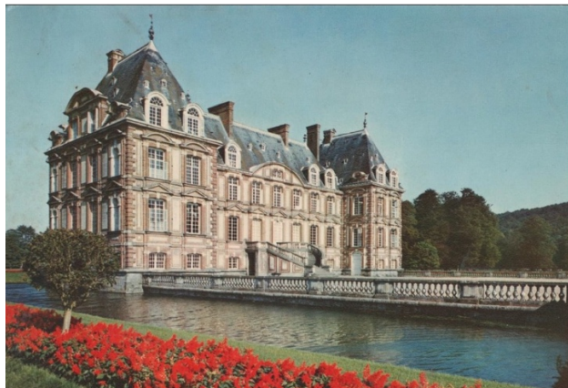
Le Château de Cany-Barville

Adresse : Château de Cany, 76450, Cany-Barville.